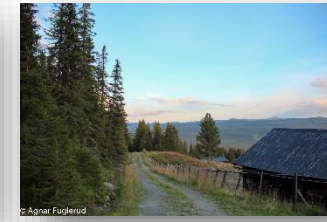
Øvre vei Saupeset