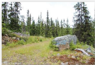
Stein ved lunneplass