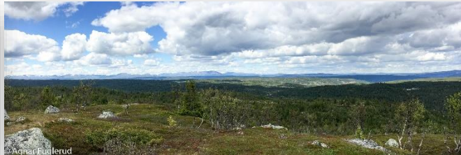
Utsikt fra Elghøgdi mot Hardangervidda