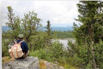
Utsyn til Damtjern